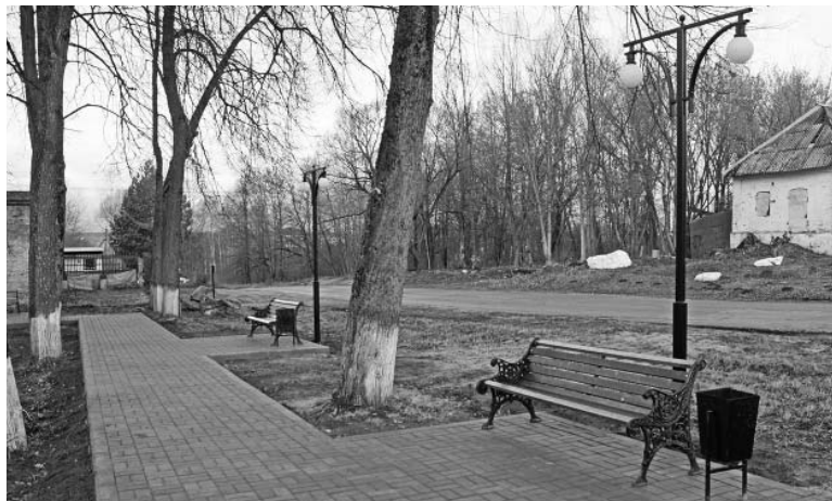
Первый этап строительства парка в Брыни завершен. Местная администрация принимает предложения от жителей по дальнейшему его обустройству и названию.