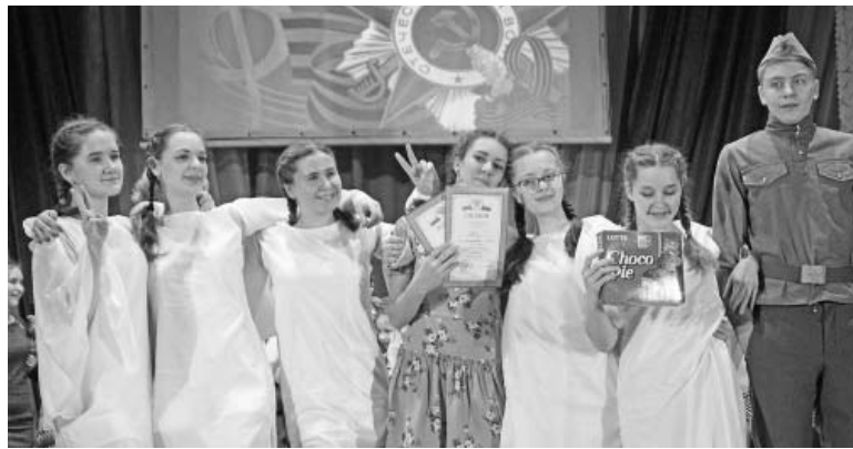
С успехом прошел в Думиничах традиционный конкурс юных талантов «Новая волна». Репортаж читайте в следующем номере.