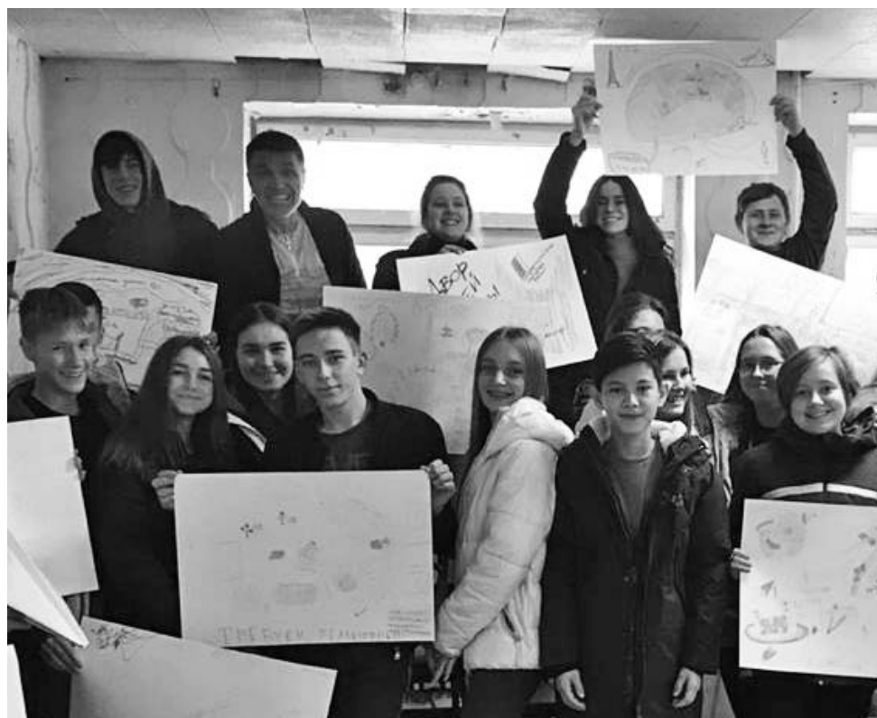
Материалы подготовлены коллективом Чернышенской СОШ.